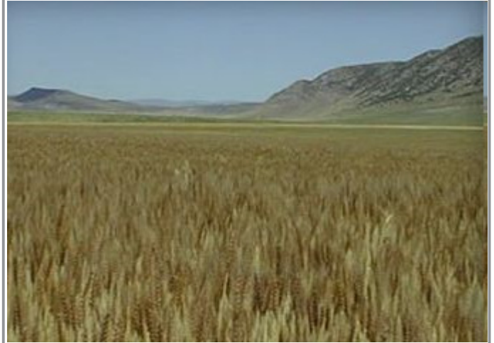
யூபிலி ஆண்டின்போது நிலம் பயிரிடப்படாமல் நிலத்துக்கு ஓய்வு அளிக்கவேண்டும் என்பது தேவ கட்டளை

ஆம். ஜனங்களது தேவைக்காகவும், ஜீவனத்திற்காகவும் தேவன் வாக்குறுதி தந்துள்ளார். இதனால் இந்தப் பிரமாணம் செயல்படுவதற்கான எவ்வித ஐயமும் ஏற்படாதபடி ஒரு முற்றுப்புள்ளி வைத்தார்.