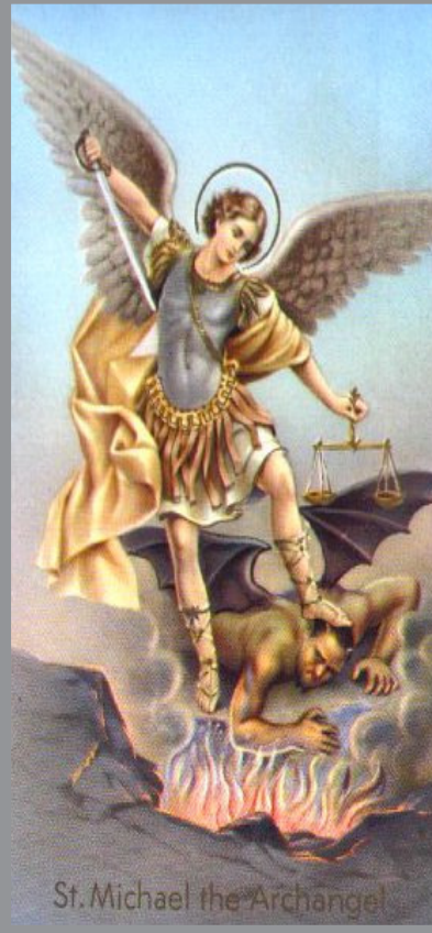
St. Michael the Archangel