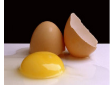
NASA States of Matter Glenn Research Center

மேலும் திரித்துவம் பற்றிய பெரிய பெரிய வல்லுனர்களும், இதற்கான விளக்கம் பற்றிக் கூறும்போது முட்டை (மேல்தோல், வெள்ளைக்கரு, மஞ்சள் கரு) தண்ணீர் (ஆவி, நீர், பனிக்கட்டி), பழம் (மேல்தோல், தசைப்பகுதி, விதை), மூன்று சக்கரவண்டி (மூன்று சக்கரங்களும் ஒரே சமயத்தில் சுழல்வது) மின்சாரம் (சுவிட்ச், ஓயர், பல்பு) இவையனைத்தும் எவ்வாறு ஒன்றுக்குள் ஒன்று உள்ளதோ, அதேபோல கடவுள்களும் உள்ளதாக விளக்கம்