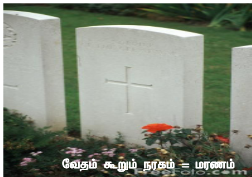
வேதம் கூறும் நரகம் = மரணம்

தேவன்தாமே நம் அனைவருக்கும் கிருபை செய்வாராக.